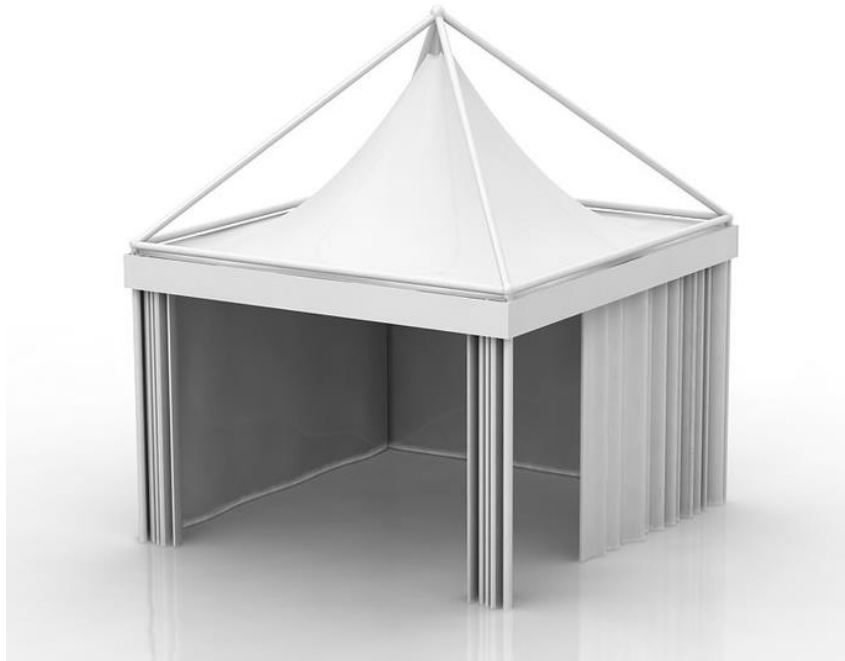
شکل ۴- نمونه غرفه‌بندی استاندارد با چادر نمایشگاهی

این نوع از سازه‌ها به دلیل نوع استراکچر اصلی آن و بادبندها، در مقایسه با سازه داربستی و اسپیس فریم، از استحکام و مقاومت بالاتری برخوردار بوده و مناسب فضاهای باز می‌باشد.