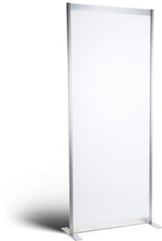
شکل ۲ - نمونه پانل جهت تفکیک فضای داخل غرفه

جهت تفکیک داخل فضای غرفه به صورت انباری در این نوع غرفه‌بندی از سازه مطابق شکل ۲ استفاده خواهد شد.