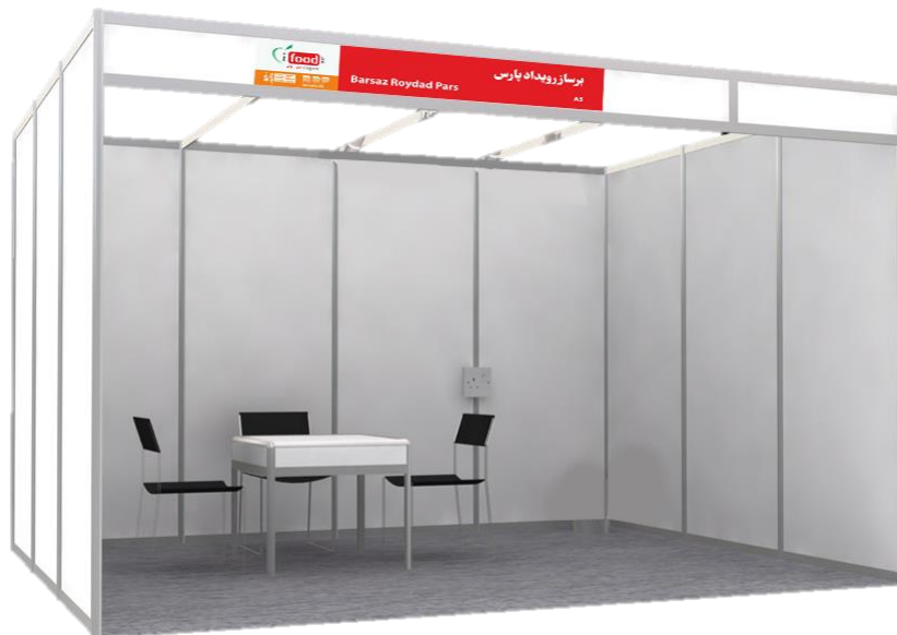
شکل ۱ - نمونه غرفه بندی استاندارد با پانل (اکتانورم)

این نوع از سازه‌ها که در فضاهای داخلی و سالن‌های نمایشگاهی کاربرد دارند، شامل پانلهایی در ابعاد ۱۰۰*۲۷۰ سانتی متر بوده که دیواره‌ها را شامل می‌شوند. سر درب غرفه نیز مطابق شکل ۱ کتیبه نام شرکت نصب می‌شود.